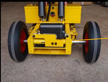
Ajustement possible de 10 cm de chaque côté