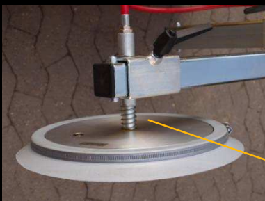
4 grandes ventouses (Ø 360 mm) . Chaque ventouse soulève 500 kg