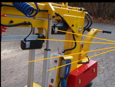
Vérins à commande électrique de 24V pour un travail sûr et précis