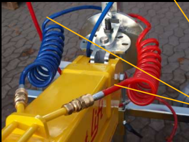
2 circuits de vide pour la sécurité