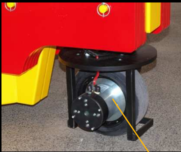
Galet motorisé électrique 1000W